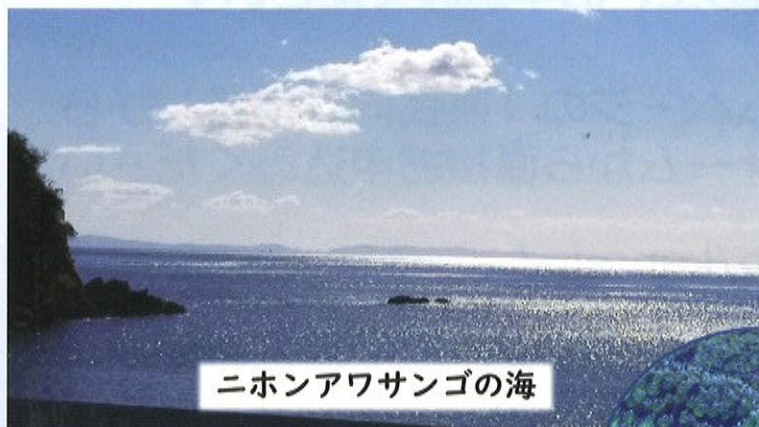
ニホンアワサンゴの海

ニホンアワサンゴの様子を知ったり、環境保全につながる炭づくりなどを行ったりして、親子で自然の大切さについて学びましょう。