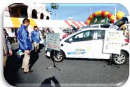
【電気自動車の展示】

災害時の電気供給のデモンストレーションとして、携帯の充電コーナーを設置しました。電気自動車は、私たちの家計の節約、生活の安全にも有効です。また、災害時の非常用電源にも活用でき、1台の電気自動車から、約4000台の携帯の充電が可能です。まさに「走る電源」といっても過言ではありません。