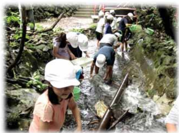
～大谷川（山口県下松市東豊井）～

児童たちは夢中になって河川の生き物を探し、見つけるたびに元気な声をあげていました。採取後は生き物を指標種ごとに分け、講師から河川の水質についての説明を真剣に聞いていました。