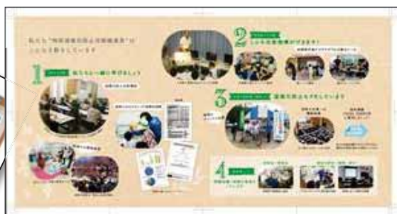
（見開き）推進員さんの活動を写真で分かりやすく解説

この度、推進員さんの日頃の活動を紹介するリーフレットを作成しました。推進員さんの温暖化防止に向けた地域での取り組みやノウハウを分かりやすく紹介してあります。