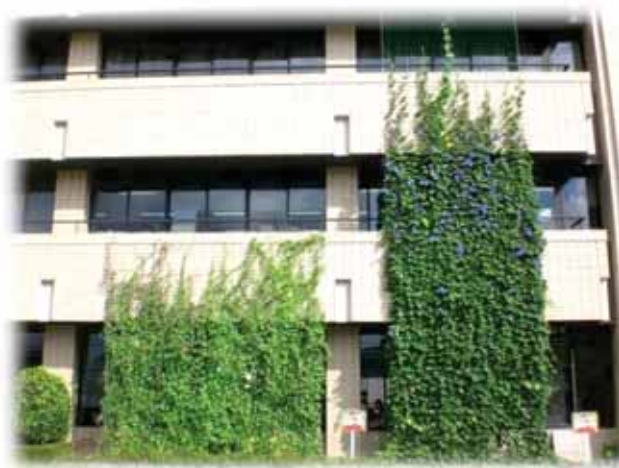
～下松市役所本庁舎環境推進課前～

また、下松市役所庁舎にも緑のカーテンを設置しています。毎年300～400個程度のゴーヤができており、下松市役所総合窓口のカウンターに置いて、市民の方々に配布しています。