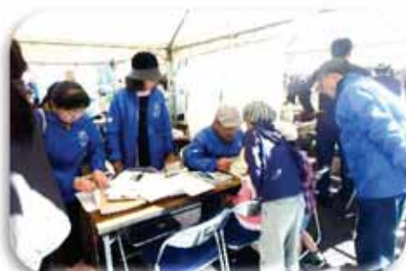
【下松市推進員ブース】