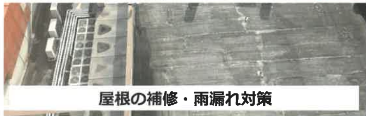
屋根の補修・雨漏れ対策