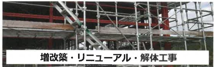
増改築・リニューアル・解体工事