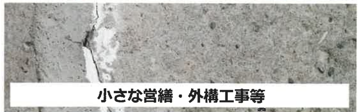
小さな営繕・外構工事等