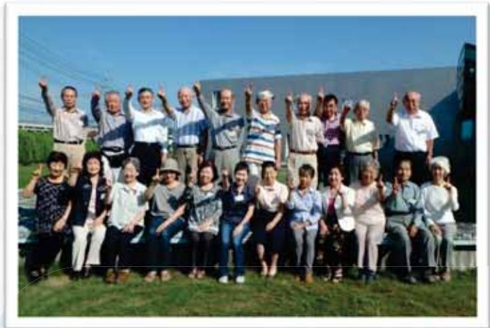
<< 西部会場 >>