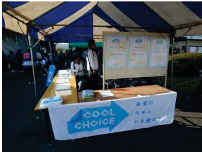
(日置ふるさとまつりの様子)

を呼びかけました。また、市内油谷川尻地区の新分別説明会でも賛同書記入の呼びかけ、合わせて100人以上の賛同をいただきました。