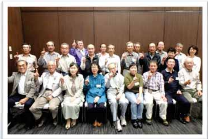
<< 東部会場 >>

10月5日(水)と19日(水)に、県内2会場で地域別推進員勉強会を開催しました。勉強会ではまず、9月に山口市で開催された「中国・四国ブロック合同推進員研修会」に県内から参加した11名の推進員の方から、研修会の報告がありました。他県の推進員から刺激を受けたこと、新たに学んだことなど、今後活かせる成果を発表していただきました。