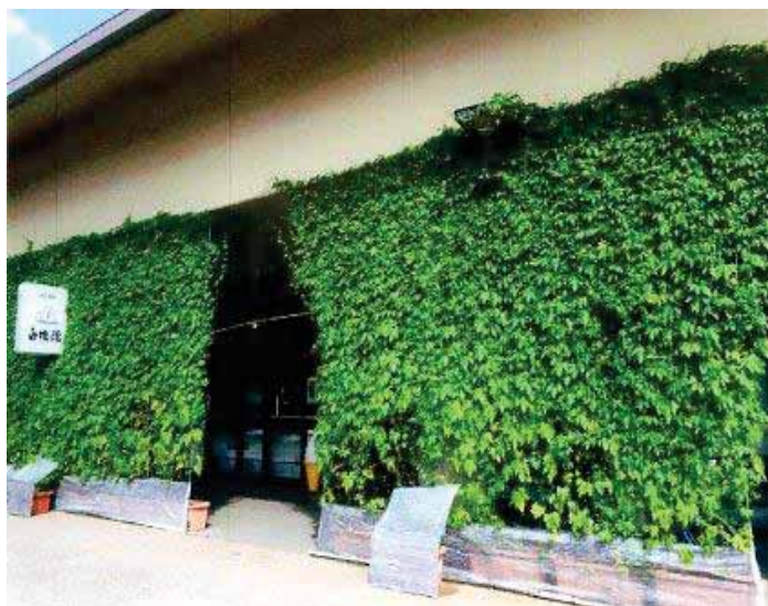
(平成27年度最優秀賞 俄山温泉合名会社・白猿の湯)

また、応募写真を市のホームページで「緑のカーテンギャラリー」として掲載しています。